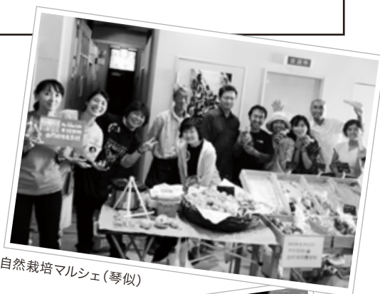
自然栽培マルシェ(琴似)